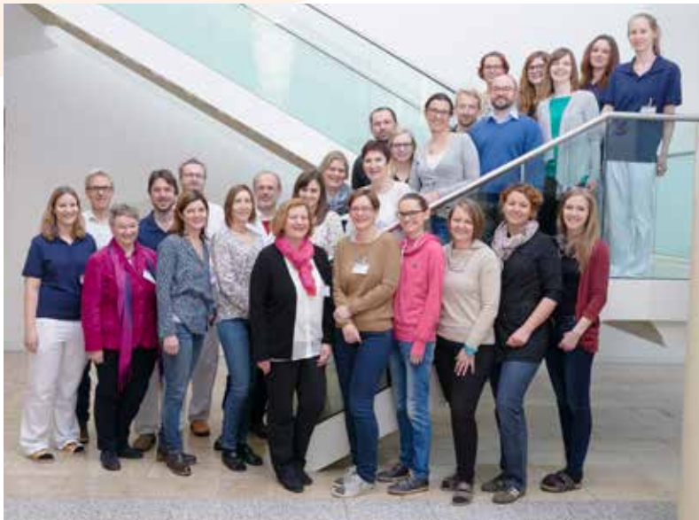
Das Team der Neurologisch linguistischen Ambulanz