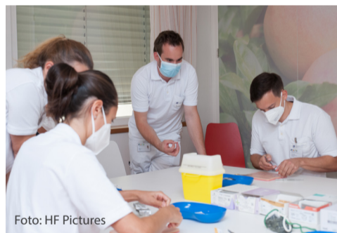
Gut angenommen wurden die Fortbildungen und Workshops für junge Ärzte im Haus

Durch die lange Tradition als akademische Lehrkrankenhäuser der medizinischen Universitäten Wien und Graz sowie Lehrabteilung der Universität Innsbruck, werden Jungmediziner einem hohen Ausbildungsstandard entsprechend ausgebildet. Dabei ist die fundierte und praxisrelevante Wissensvermittlung wichtig, welche die Medizin in einem breiten Spektrum abbildet. Mit dem Start eines innovativen Weiterbildungskonzeptes für Jungärzte in Ausbildung setzen das Krankenhaus St. Veit und das kooperierende Elisabethinen-Krankenhaus Klagenfurt wichtige Schritte in der qualifizierten, praxisnahen Grundausbildung der Ärzte von morgen. Mit den Weiterbildungsformaten „Summer teaching“ für Famulanten und Studierende, die das Klinisch-Praktische Jahr absolvieren und dem „Journal Club“ für Turnus- und Assistenzärzte, boten die Häuser ihren Auszubildenden über den Sommer ein praxisnahes, klar strukturiertes Weiterbildungsprogramm an.