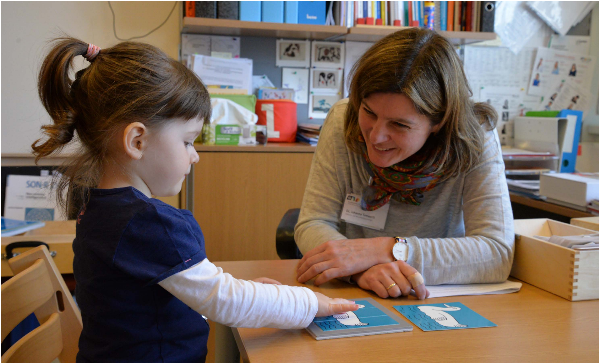
Bei der Psychologin mache ich lustige Aufgaben. Ich kann zeigen, wie ich sie löse.