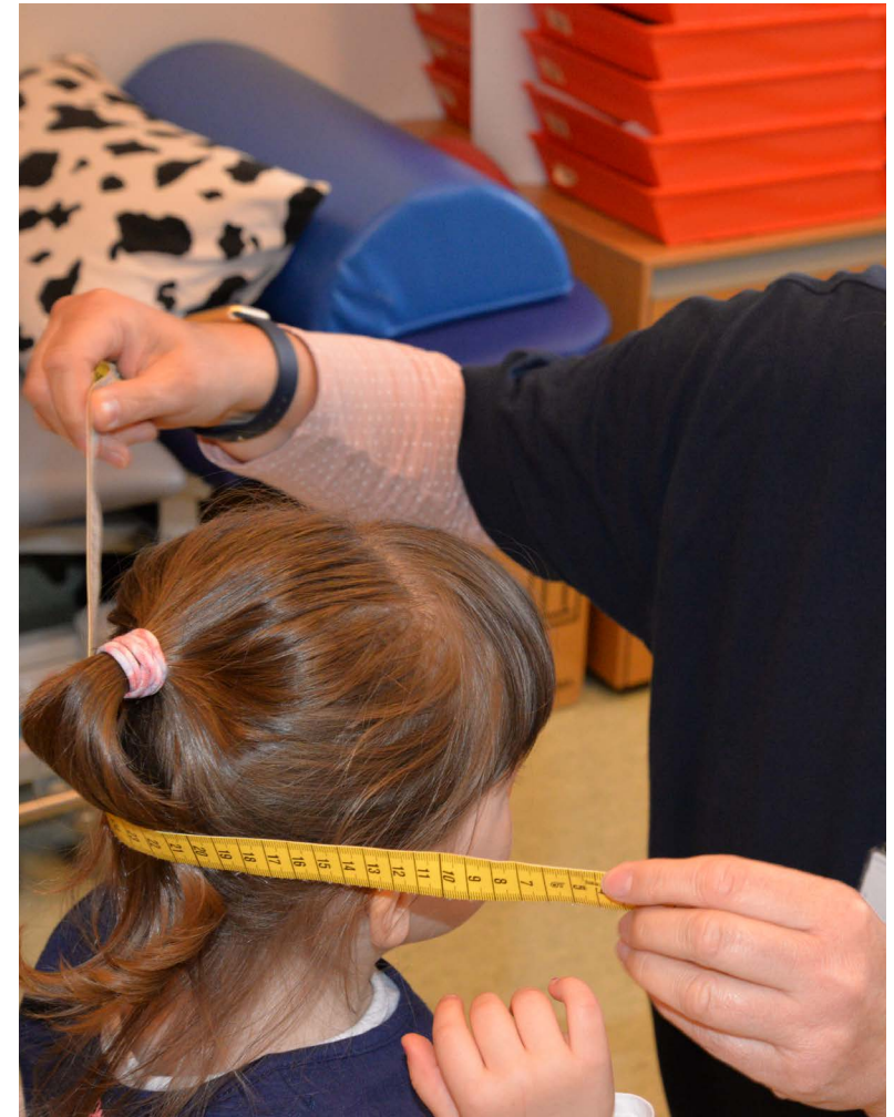
Die Frau Doktor schaut auch in meine Ohren und schaut, wie groß mein Kopf schon ist.