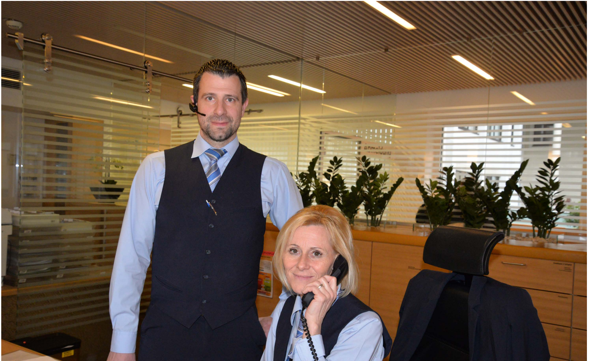
Die Menschen sind sehr freundlich.