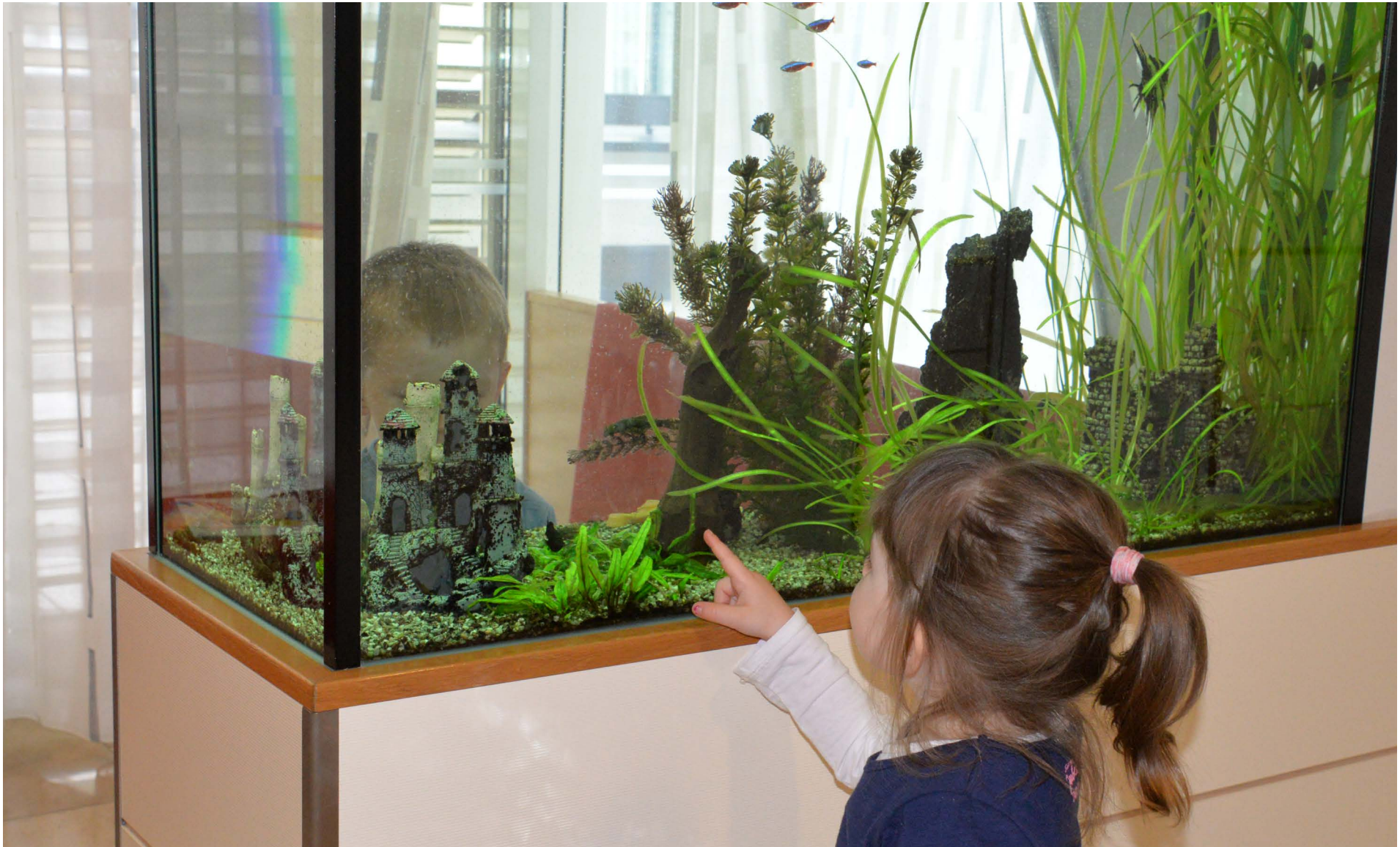
Am Gang gibt es ein Aquarium mit bunten Fischen.