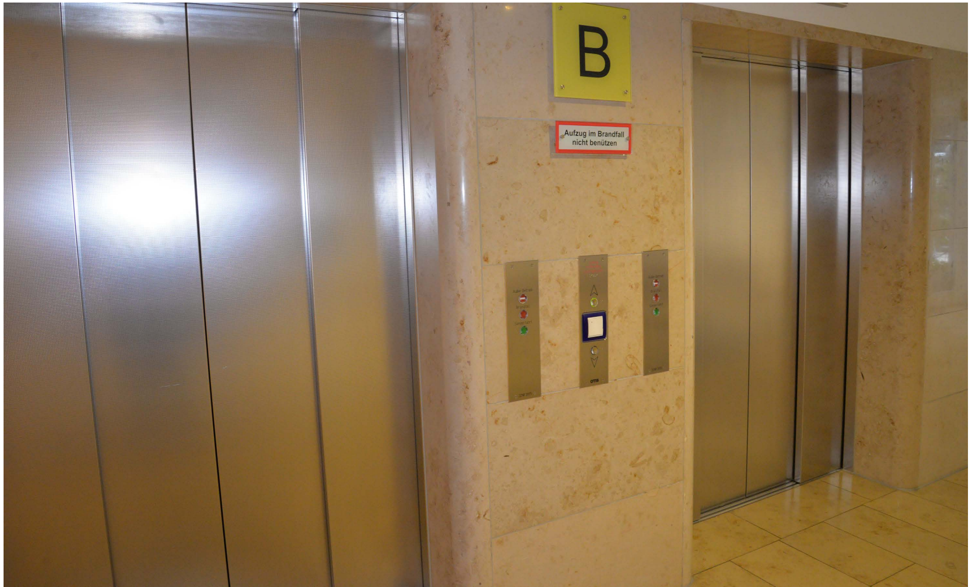
Wir gehen zum Lift B.