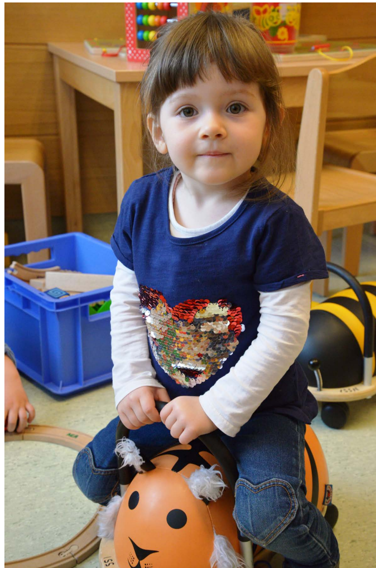
Im Wartezimmer darf ich noch ein bisschen spielen.