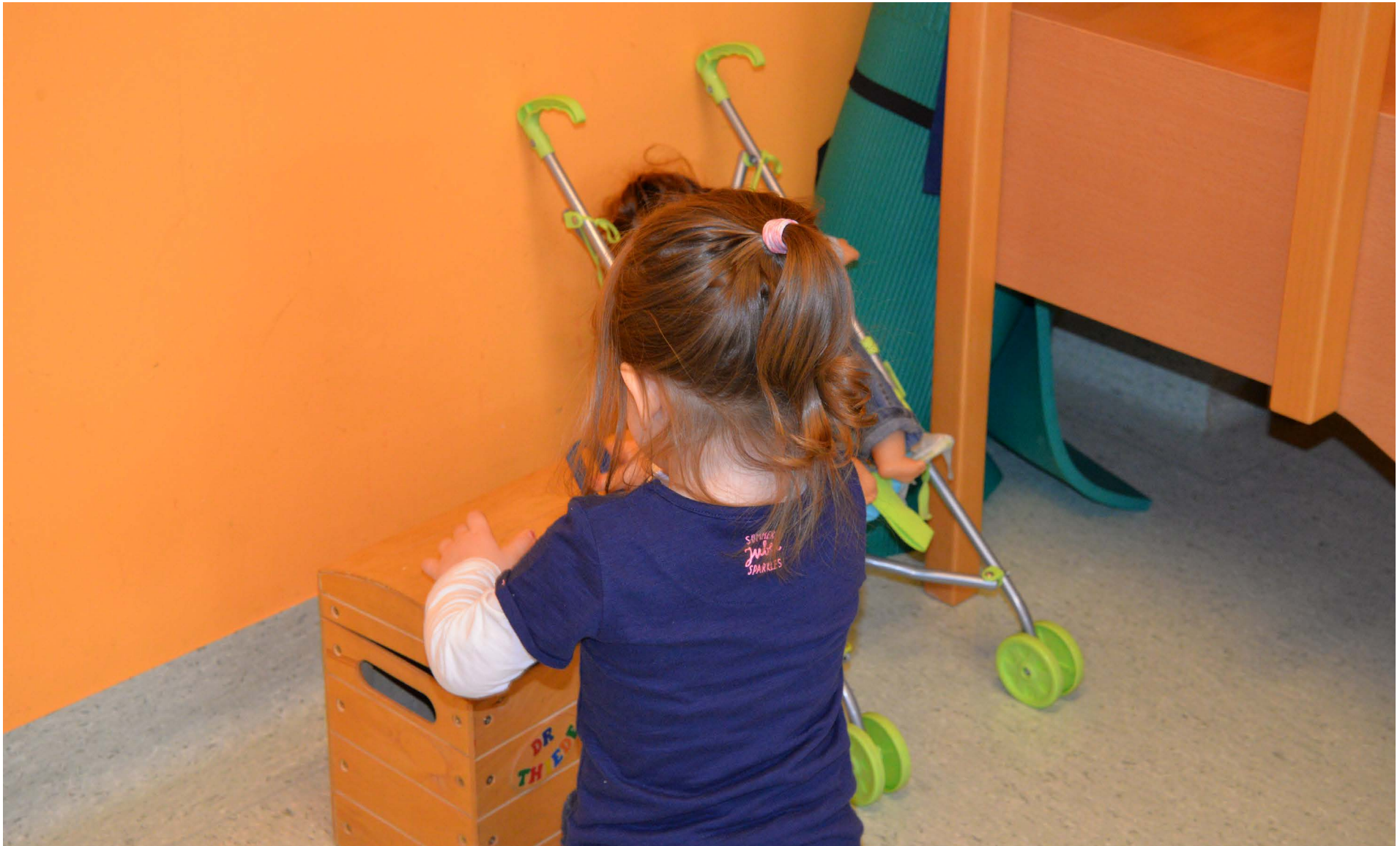
Im Wartezimmer warte ich auf die nächste Untersuchung.