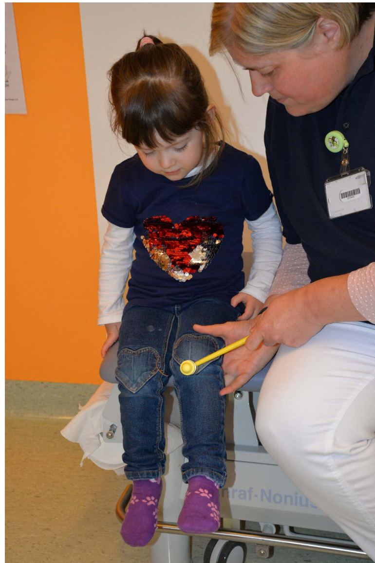
Zum Schluss sitze ich auf der Liege. Die Ärztin klopft vorsichtig auf mein Knie.